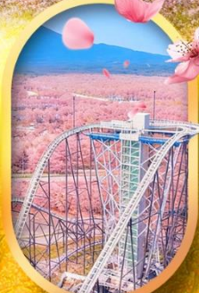
ฟูจิยาม่า ทาวเวอร์