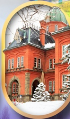
ศาลาว่าการฮอกไกโด