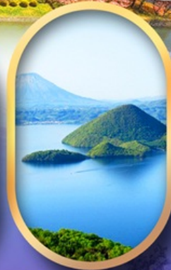
วิวทะเลสาบโทโยะ