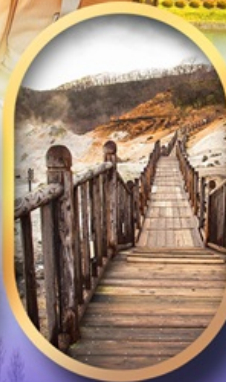
หุบเขาจิกุกุดาบิ