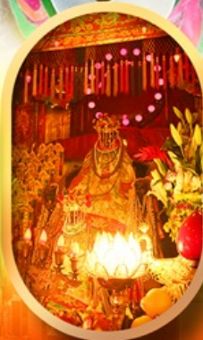
เจ้าแม่กวนอิมทองคำ