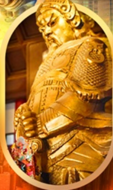
เทพวัดแซง