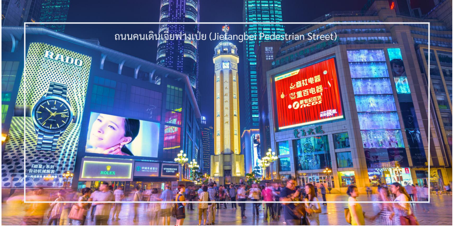
ถนนคนเดินเจียงเป่ย์ (Jiefangbei Pedestrian Street)

เมืองฉงชิ่ง ทำให้สามารถเดินเที่ยวชมได้อย่างสะดวก ถนนสายนี้มีบรรยากาศที่มีชีวิตชีวา โดยเฉพาะในช่วงเย็นที่มีแสงไฟและการแสดงต่างๆ ที่ทำให้บรรยากาศน่าสนใจยิ่งขึ้น และยังเต็มไปด้วยร้านค้าแบรนด์เนม ร้านค้าท้องถิ่น และตลาดที่ขายสินค้าต่างๆ เช่น เสื้อผ้า เครื่องประดับ และของที่ระลึก และยังมีร้าน POP MART ร้านดังจากจีน ที่รวมฟิกเกอร์ดีไซน์เก๋และตุ๊กตาน่ารักหลากหลายซีรีส์ยอดนิยม เช่น Molly, Dimoo, Labubu และอีกมากมาย ที่สายสะสมของเล่นไม่ควรพลาด