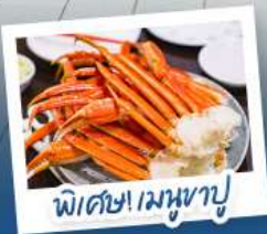
พิเศษ! เมฆหุบ