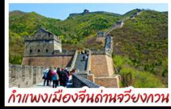
กำแพงเมืองจีนด้านจิวยงกวน

UNIVERSAL STUDIO BEIJING DISNEYLAND SHANGHAI รถไฟความเร็วสูง - ถ่ายรูปห่อไข่มุก กำแพงเมืองจีนด้านจิวยงกวน บ๊วยพิเศษ เปิดปักกิ่ง, สุกี่หม้อไฟ BUFFET