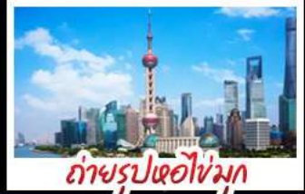
ถ่ายรูปไข่มุก