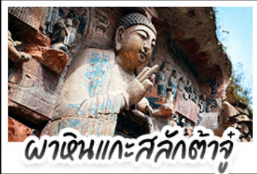
พาเดินแกะสลักต้าจู้