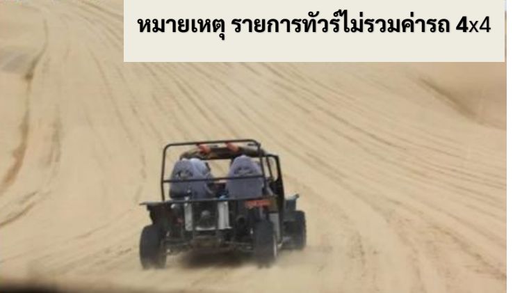
หมายเหตุ รายการทัวร์ไม่รวมค่ารถ 4x4

กลางวัน รับประทานอาหารกลางวัน ณ ภัตตาคาร (เมื่อที่ 8)