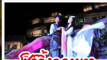
ชีวิตจิ้งจอกขาว