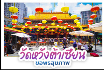
วัดเซ่งเต้าเซี่ยน บ่อพรสุภภาพ