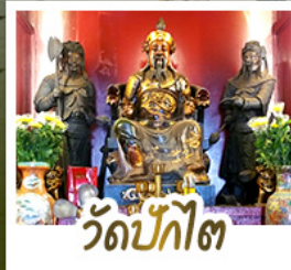
วัดป้กั๊ต