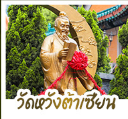
วัดเว้งต้าเซียง