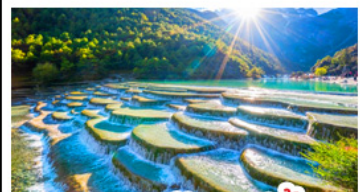
เขุบเขาพระจันทร์สีน้ำเงิน

ภูเขาหิมะมังกรหยก - เมืองโบราณเซกรีล่า วัดลามะชงจันหลิน - รถไฟชมวิวภูเขาหิมะมังกรหยก สวนดอกไม้ฮวงอวี่มู่ฉ่าง - เมืองโบราณลี่เจียง หุบเขาพระจันทร์สีน้ำเงิน - เบนูพิเศษ สุกี้ปลาเซลมอน