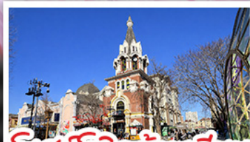
โบสถ์โกธิคตาเหลียน