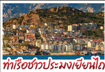
ท่าเรือชาวประมงเยียนไถ