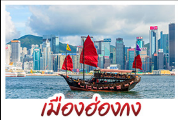
เมืองฮ่องกง

เมืองเก่าชิงเต่า - วิวเมืองฮ่องกง โรงเบียร์ชิงเต่า - ท่าเรือชาวประมงเยียนไถ