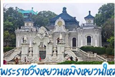
พระราชวังเซวานเหมิงเซวานไห่เหมิง