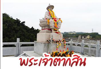
พระเจ้าตากสิน