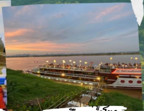
ล่องเรือแม่น้ำโขง