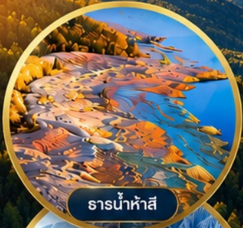
ธารน้ำห้ำสี่