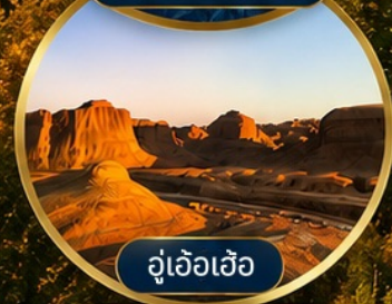
อุเอ้อเอ้อ