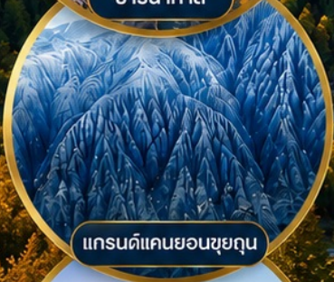
แกรนด์แคนยอนซุยกุน