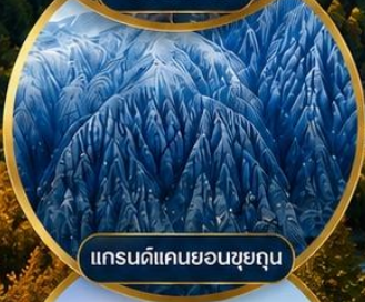
แกรนด์แคนยอนชุยถุน