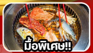
มือพิเศษ!!