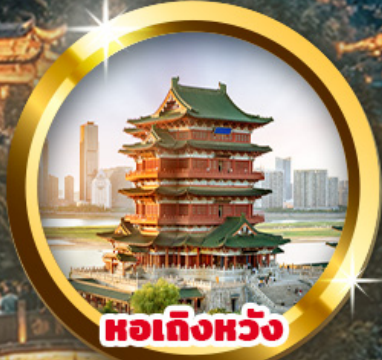
หอเถิงหวัง