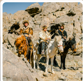
ชนเผ่ามองโกเลีย