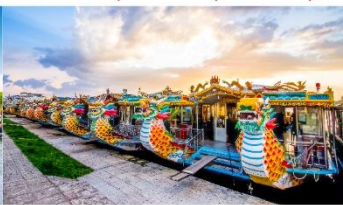
ล่องเรือมังกร