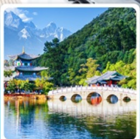
สระมิงกรต้า

ไฮไลท์ ที่ควรรู คุณหมิง ต้าหลี่ ลี่เจียง แชงกรี่ล่า นั่งกระเช้าขึ้นภูเขาหินะมิงกรหยก ชมโชว์ "Impression of Lijiang"