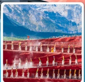
Impressions of Lijiang