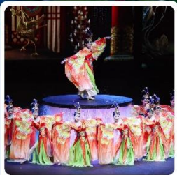
โซว FOSHAN QIANGUING