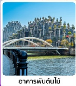
อาคารพันตันไม้

• โฮเทล ที่ย่านมหานครเซี่ยงไฮ้ ส่องเรือชมความงามของทะเลสาบซีหู อิสระช้อปปิ้งถนนนานกิงและฟอรัมเทียวิลเลจ เอากั๊ก