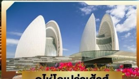
ดูให้โอเปร่าเฮ้าส์