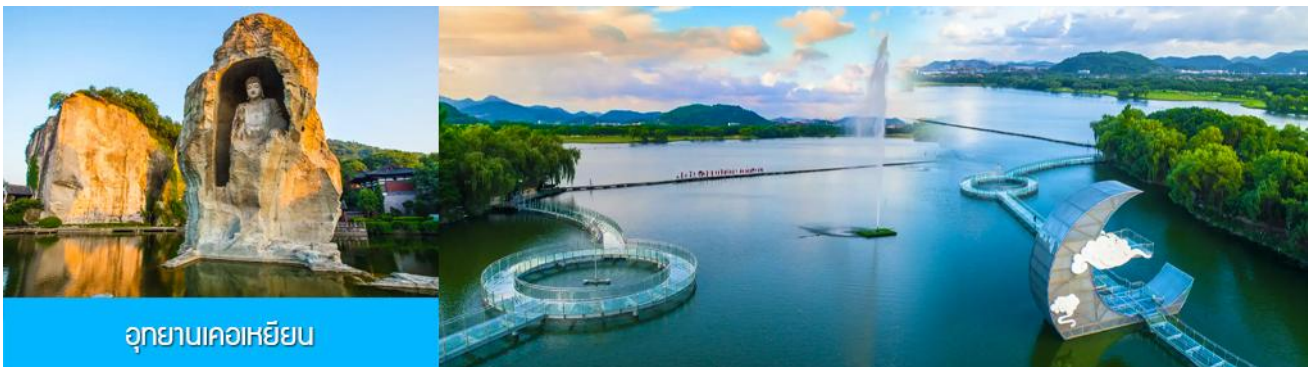
อุทยานเคอเหยียน

พักที่ โรงแรม KAIYUAN MINGTING HOTEL 4* หรือเทียบเท่าในเมืองเส้าชิง