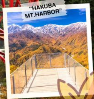
"HAKUBA MT. HARBOR"

วันเดินทาง 28 ต.ค. - 3 พ.ย. 2569 4 - 10, 11 - 17 พ.ย. 2569