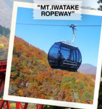
"MT. IWATAKE ROPEWAY"