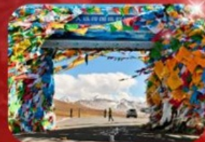
ทางเข้าสู่ดินแดนเอเวอเรสต์