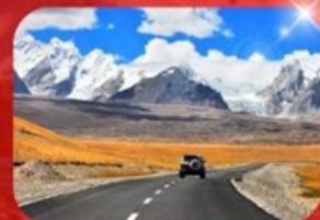
ถนนสายมิตรภาพจีน-เนปาล

พักโรงแรม 4 ดาว ★★★★★ ฟรี ประกันอุบัติเหตุ บริการ อาหารท้องถิ่น