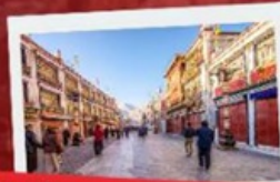
ข้อบังคับถนนแปดเหลี่ยม