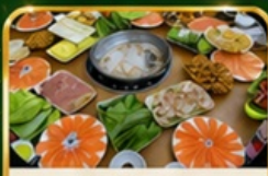
ชาปูแชลมอน