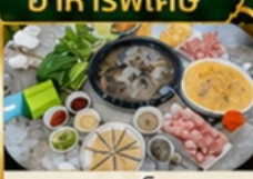
ชาปูเห็ด