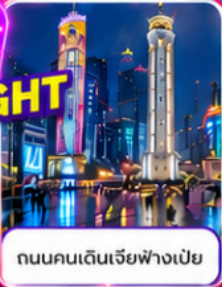
ถนนคนเดินเจียงฟางเป่ย์