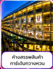
ห้างสรรพสินค้า การ์เด็นทววงหวน