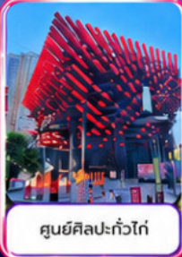
ศูนย์ศิลปะแก้วโก่