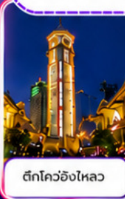
ตึกโควอิ่งไหลว