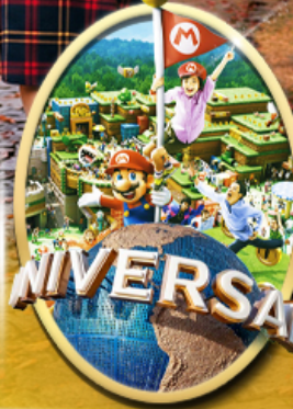
อิสระเลือกซื้อบัตร Universal Studios Japan