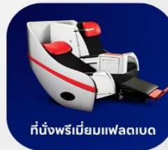
ที่นั่งพรีเมียมฟเลกซ์