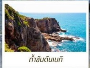
ท่าชินเด็นเบกิ