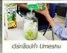
เวิร์กช็อปทำ Umeshu