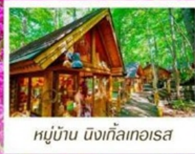
หมู่บ้าน นิงเกิลทอเรียส