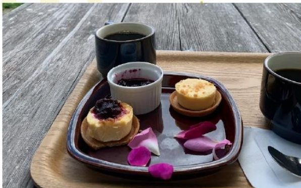
TOKACHI MILLENNIUM FOREST

อิสระให้ท่านได้ปล่อยใจไปกับ “Earth Garden” เป็นหญ้าสีเขียวขจีที่ถูกออกแบบให้เป็นลอนคลื่นนุ่มนวล ทอดตัวยาวเหยียดไปจนสุดสายตาติดกับขอบฟ้าสีคราม ท่านสามารถเดินเล่นรับลมเย็นบริสุทธิ์ หรือเลือกหาหม่อมเพื่อพักผ่อน พร้อม จิบเครื่องดื่ม (รวมในรายการ) ท่ามกลางทัศนียภาพที่เงียบสงบและงดงามราวกับภาพวาดสีน้ำมัน ให้ธรรมชาติช่วยบำบัดความเหนื่อยล้าและเติมเต็มพลังงานให้กับร่างกายและจิตใจ