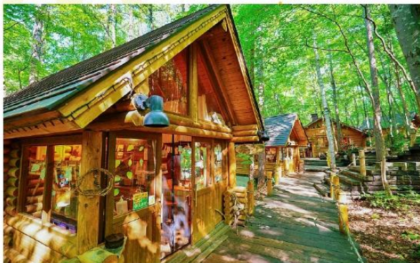
FURANO NINGLE TERRACE