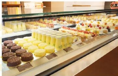
FURANO DELICE CAFE