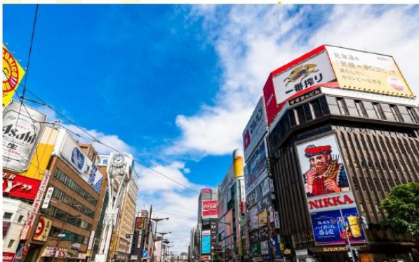
SHOPPING AT SUSUKINO

อิสระอาหารค่ำตามอัธยาศัย (ไม่รวมในรายการ)