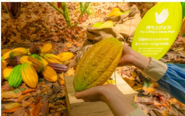
ROYCE CACAO & CHOCOLATE TOWN