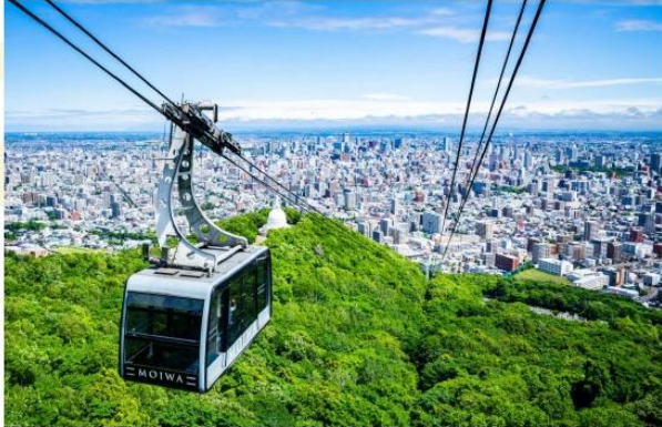
MT.MOIWA (CABLE CAR)