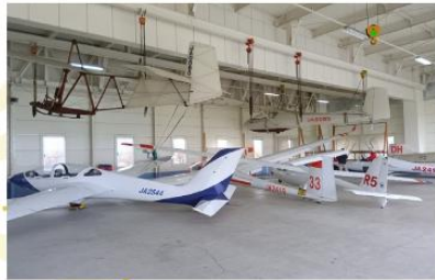
TAKIKAWA SKY PARK MUSEUM