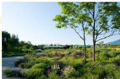
TOKACHI MILLENNIUM FOREST