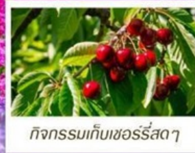
กิจกรรมเก็บเชอร์รี่สดๆ