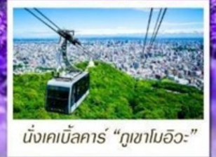
นั่งเคเบิลคาร์ "ภูเขาโมอิวะ"