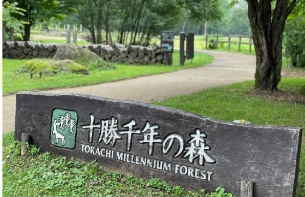
TOKACHI MILLENNIUM FOREST