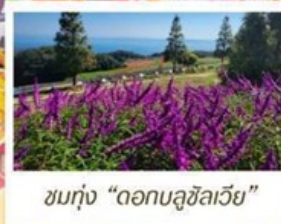
ชมทุ่ง "ดอกบลูซิลเวีย"