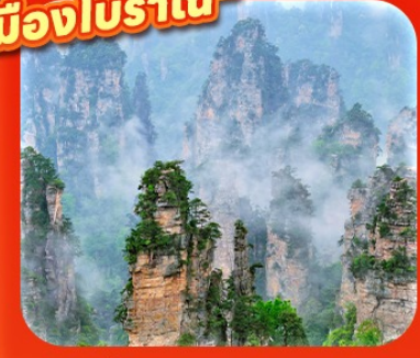
"หุบเขาอวตาร"