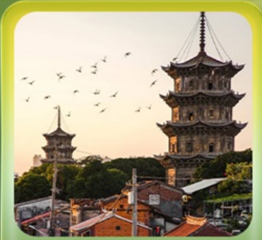
“เมืองโบราณฉวนโจว”