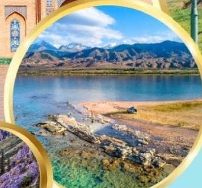
ล่องเรือทะเลสาบอิสซิค