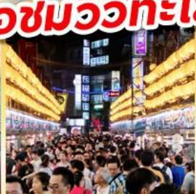
โดงไนท์มาร์เก็ต