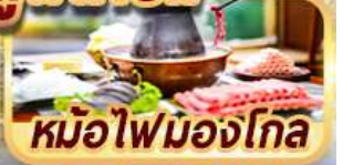
หม้อไฟมองโกล