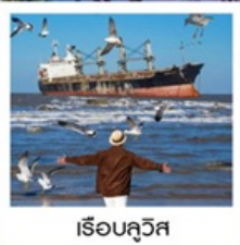
เรือลิวอิส