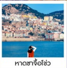
หาดซาจื่อฮั่ว