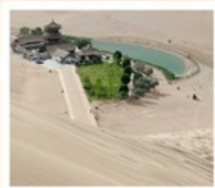
เขื่อนทรายหมิงซาซาน