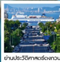
ย่านประวัติศาสตร์ตงกวน

Fisherman's Wharf • จัตุรัสชิงไห่ (รวมรถราง) • ถนนตงกวน • เวนิสแห่งต้าเหลียน • ถนนรัสเซีย ย่านประวัติศาสตร์ และวัฒนธรรมตงกวน • นังรถรางเมืองต้าเหลียน • กำแพงเมืองจินด่านจิวหยกวน • ซานหลี่กู่ • ถนนคนเดินไท่กู่หลี่