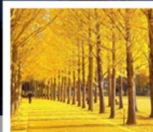
สวนเอ็กซ์โป