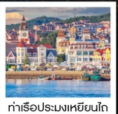
ท่าเรือประมงเหียนโก