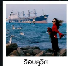
เรือควิวส

หอคอยกาลเวลา / รูปปั้นปลาวาฬ / ถนนโบราณเตาหยาง / ย่านสงโขว่ 1920 / เมืองเว่ยไห่ / ถนนฮั่วจวีปา / จตุรัสประตูแห่งความสุข ย่านอันลอฟาง / เรือควิวส / หาดซาจื่อโซ่ว / ถนนหลงเจียง / สะพานจันเจียว / หาดไซเบอร์ No. 3 ถนนจงซาน / โบสถ์ St.Emill / จตุรัส 54 / ศูนย์เรือใบโอลิมปิก / พิพิธภัณฑ์มิแยร์ชิงเต่า / ถนนโตตง / ท่าเรือประมงเหียนโก