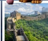
กำแพงเมืองจีนด่านซือหม่าโต