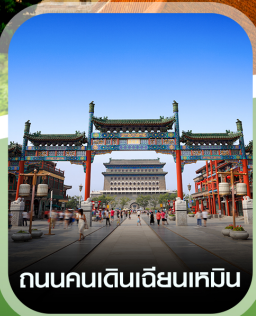
ถนนคนเดินเฉียนเหมิน