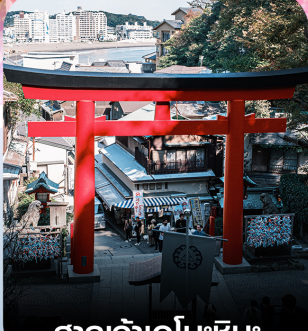
ศาลเจ้าเอโนะชิมะ