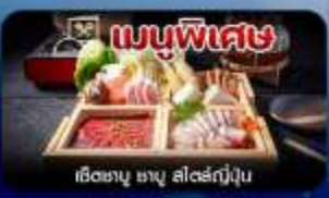
เมนูพิเศษ เซตซาบู ซาบู สไตล์ญี่ปุ่น

โตเกียว-ฟูจิ-คามิโคจิ-ทะเลสาบคาวากุจิโกะ-หมู่บ้านน้ำใส-เมืองเก่าคาวาโกเอะ-คารุชิวาว่า-อีสะะช้อปปิ้งเต็มวัน