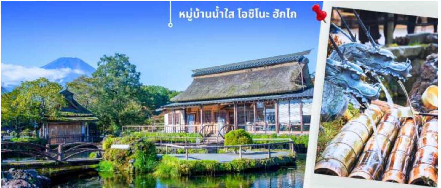
หมู่บ้านน้ำใส โอชิโนะ อักโก

นำท่านแวะชม พิพิธภัณฑ์แผ่นดินไหว เป็นพิพิธภัณฑ์ที่แสดงถึงผลกระทบจากภัยพิบัติแผ่นดินไหวและการระเบิดของภูเขาไฟ ภายในพิพิธภัณฑ์มีห้องจัดแสดงข้อมูลการประทุของภูเขาไฟจากทุกมุมโลก โชนความรู้ต่างๆและโชนซ์อปปิ้งสินค้าญี่ปุ่น อาทิเช่น ผลิตภัณฑ์เครื่องสำอางและของฝากอีกมากมาย