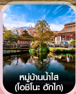
หมู่บ้านน้ำใส (โอชิโนะ ะทิก)