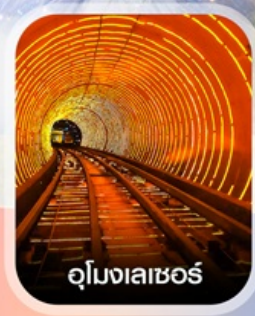
อุโมงเลเซอร์

✈️ คอนเฟิร์มออกเดินทาง ✈️ ทุกพีเรียด 2 ท่านขึ้นไป