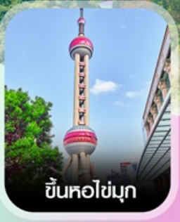
ขึ้นหอไข่มุก