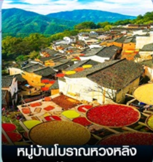
หมู่บ้านโบราณหวงหลิง (หมู่บ้านตากพรึก)